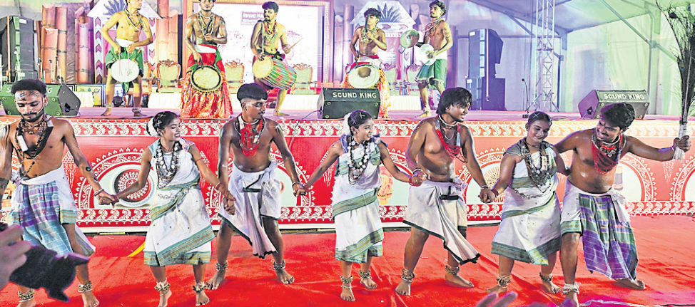
ବାଲିଯାତ୍ରା ଉପର ପଡ଼ିଆରେ ଅନୁଷ୍ଠିତ ଆଦିବାସୀ ମହୋତ୍ସବରେ ପରିବେଷିତ ଆଦିବାସୀ ନୃତ୍ୟ।