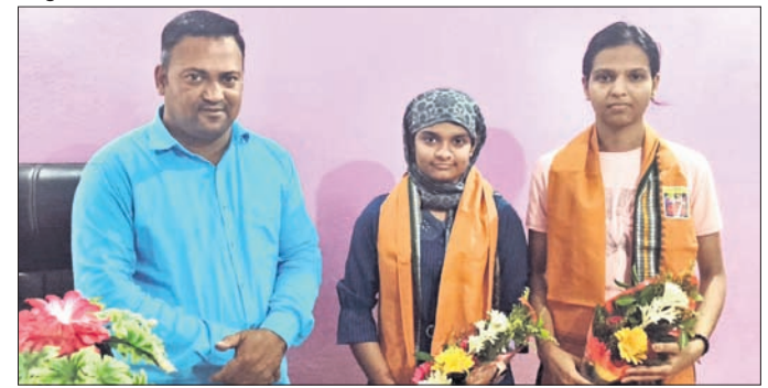
୨ ଛାତ୍ରୀଙ୍କୁ ସରପଞ୍ଚ ସମର୍ପିତ କରୁଛନ୍ତି।