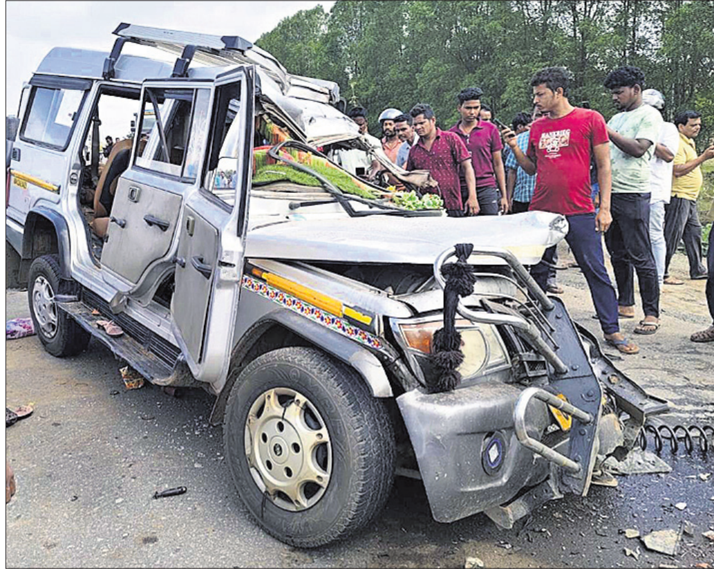
ଦୁର୍ଘଟଣାରେ କ୍ଷତିଗ୍ରସ୍ତ ହୋଇଥିବା ବୋଲେରୋ ।