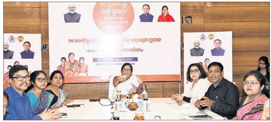
ବିଭାଗୀୟ ଅଧିକାରୀଙ୍କ ଉପସ୍ଥିତିରେ ଉପଯୁକ୍ତାୟତ୍ତା ପ୍ରଦାନା ପରିଚ୍ଛା ସୁଭଦ୍ରା ଟିଏସ୍‌ସି ହିତାଧିକାରୀଙ୍କୁ ୧୧ କୋଟି ଟଙ୍କା ପ୍ରଦାନ କରାଯାଇଛି।

ଭୁବନେଶ୍ୱର, ୪୫୫ (ସୂଚନା ସାହୁ) ସୁଭଦ୍ରା ପ୍ରଥମ, ଦ୍ୱିତୀୟ ଓ ତୃତୀୟ କିଛି ବାଦ ପଡ଼ିଥିବା ୧୯ ହଜାରରୁ ଊର୍ଦ୍ଧ୍ୱ ହିତାଧିକାରୀଙ୍କୁ ଯୋଗ୍ୟତା ଯେପରି ବାଦ ପଡ଼ିଛି ତାହା ନିଶ୍ଚିତ କରିବାକୁ ସରକାର ପ୍ରତିବଦ୍ଧ। ବିଭିନ୍ନ ପ୍ରଶାସନିକ ପ୍ରକ୍ରିୟାରେ ବିଭାଗୀୟ ମାମଲାଗୁଡ଼ିକର ବ୍ୟବହାର ଯାହା ଏବଂ ଅଭିଯୋଗ ନିରାକରଣ ମାଧ୍ୟମରେ ସମାଧାନ ପରେ ଏହି ଅର୍ଥ ପ୍ରଦାନ କରାଯାଇଛି। 'ସୁଭଦ୍ରା' ଯୋଜନା ରାଜ୍ୟରେ ମହିଳାମାନଙ୍କ ଆର୍ଥିକ ସମ୍ବଳୀକରଣ ଦିଗରେ ଏକ ପ୍ରମୁଖ ପଦକ୍ଷେପ। ଏହା ସ୍ୱଳ୍ପତା ଏବଂ ଠିକ ସମୟରେ