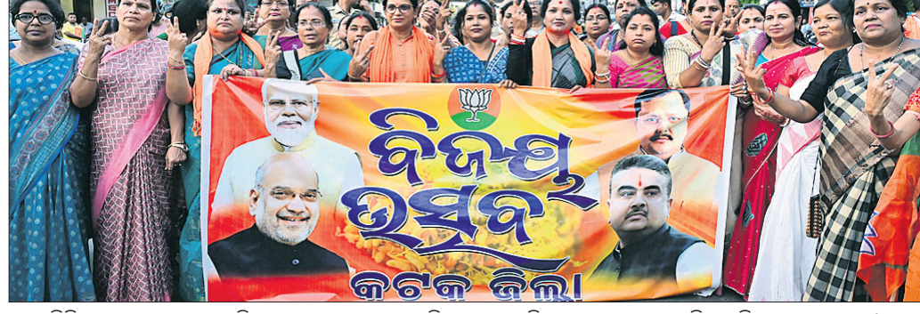
ବିଭିନ୍ନ ରାଜ୍ୟରେ ଭାଜପା ବିଜୟ ନେଇ ଭାଜପା କଟକ ଜିଲ୍ଲା ପକ୍ଷରୁ ବୃଦ୍ଧବଞ୍ଚା ଛକଠାରୁ ବାହାରିଥିବା ବିଜୟ ଶୋଭାଯାତ୍ରା।