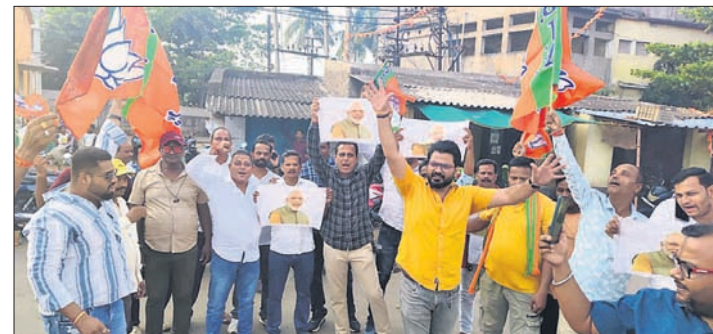
କଟକରେ ଭାଜପା ନେତା ଓ କର୍ମୀମାନେ ବିଜୟ ଉତ୍ସବ ପାଳନ କରୁଛନ୍ତି।

କଟକ/ ବେଙ୍ଗୁଳିଆ, ଧାଃ (ରବୀନ୍ଦ୍ରନାଥ ମହାକୁଟ୍ଟ/ ହର ପ୍ରସବ ପଠା):